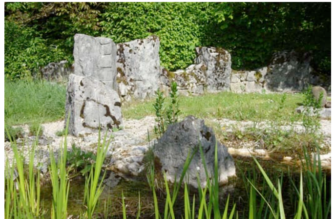
"Little Stonehenge": Das Kernstück des Gartens